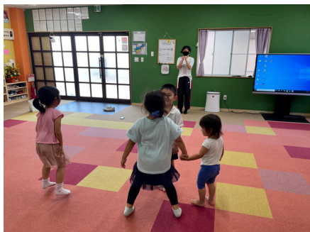
①山梨県の廃材を利用して看板を作成しました。②陶芸教室の活動。完成したときの感動は忘れられません。③日常の様子です。